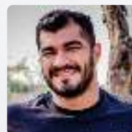
Dir. Desporto e Lazer Álvaro Leite de Moraes